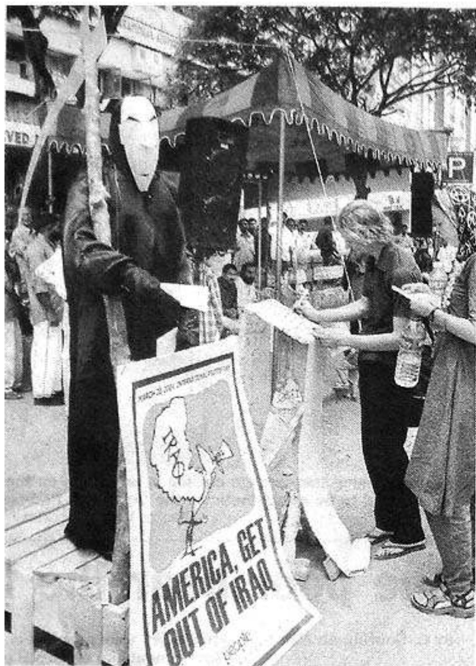
A foreigner endorses a campaign organised by Design & People demanding the withdrawal of the U.S.-led forces from Iraq, in the city on Saturday.

People signed on a 10-metre-long white cloth, registering their protest against the U.S. action. Among those signed were a few European tourists.