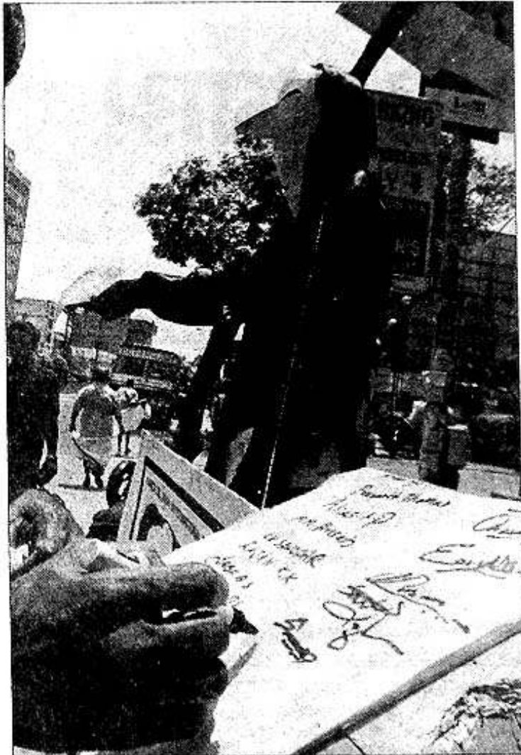
ഡിസൈൻ ആൻറ് പീപ്പിളിന്റെ ആഭിമുഖ്യത്തിൽ ഇറാഖിലെ ജനതക്ക് ഐക്യദാർഢ്യം പ്രഖ്യാപിച്ച് മേനക ജോർഷ്വനിൽ നടത്തിയ ഒപ്പുശേഖരണം